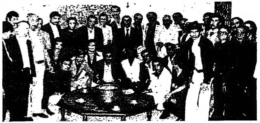
الرئيس فرنجيّة ونواب زغرنا وزوجها يتوسطون أفراد العائلة بعد المصالحة